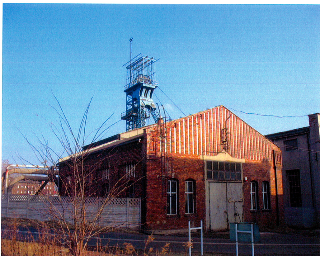
Zabudowa w rejonie ulicy Olimpijskiej (tereny byłej kopalni Richter)