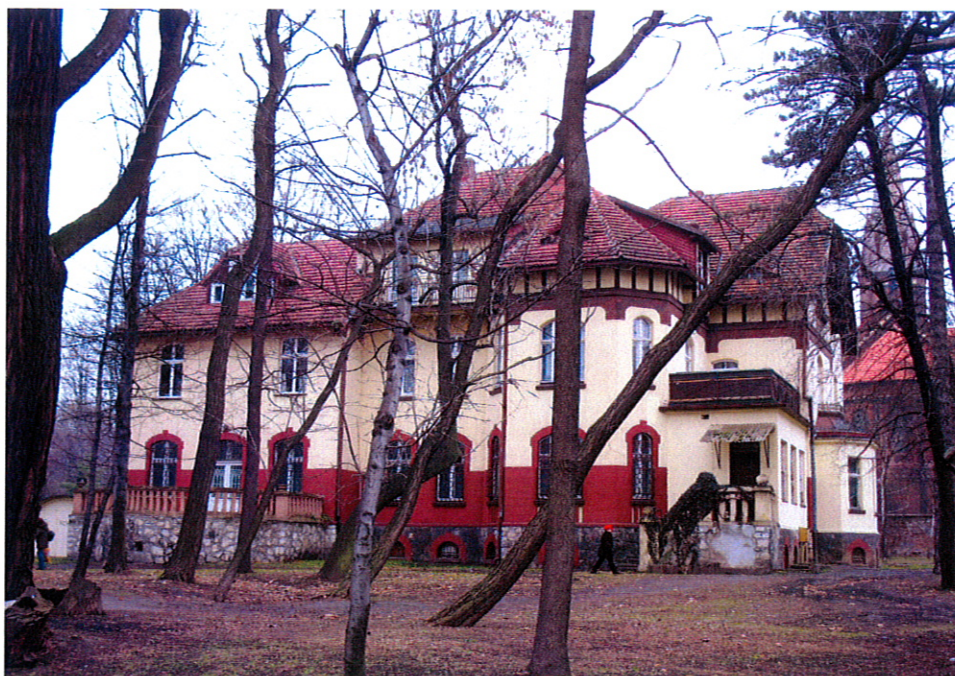
Willa przy ul. Oświęcimskiej 2

34. Wille przy ul. 1 maja 3, 5 – nr 3 własność prywatna; właściciel od lat nie użytkuje budynku, który niszczeje; nr 5 wpisana jest do rejestru zabytków i wykonano remont wnętrza.