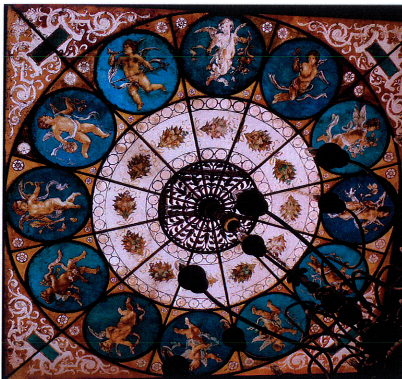
Świetlik w sali reprezentacyjnej willi Fitznera