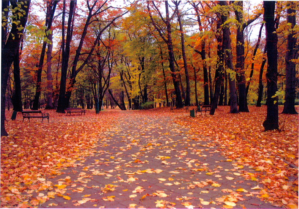
Aleja w Parku Miejskim