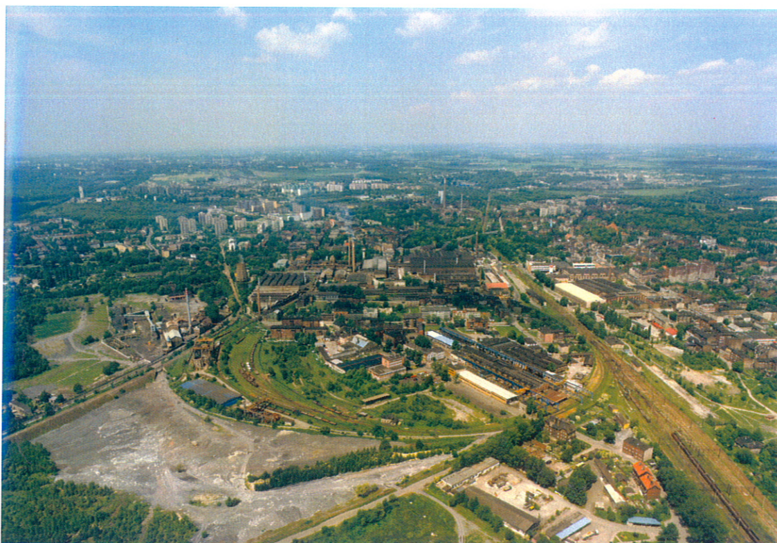
Fabryka Elementów Złącznych (rejon ulic Głowackiego, Matejki, Fabrycznej)