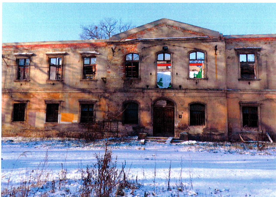
Zachodnie skrzydło pałacu Donnersmarcków. Stan z grudnia 2014 r.