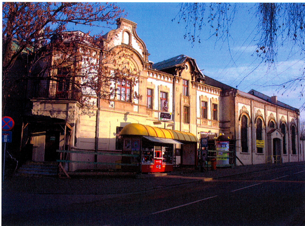
Siemianowickie Centrum Kultury przy ul. Niepodległości 45

Ufundowana przez Spółkę Akcyjną Zjednoczonych Hut Królewskiej i Laury w 1908 r. dla pracowników huty "Laura". Projekt wykonał budowniczy Emil Twrdy z Pszczelnika. Budynek z czerwonego klinkieru z białymi elementami zdobniczymi. Rozbudowany (przedłużony) w latach 70. XX w. przy czym usunięto wówczas szatnie znajdujące się na emporze. Usytuowany na obrzeżach zabytkowego parku „Hutnik”. Wyremontowany wewnątrz pod koniec XX w. i przywrócony do użytkowania.