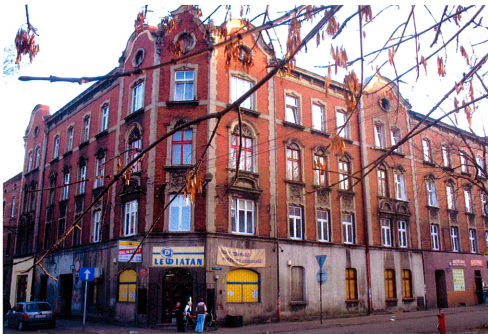
Kamienica przy ul. Szkolnej 1