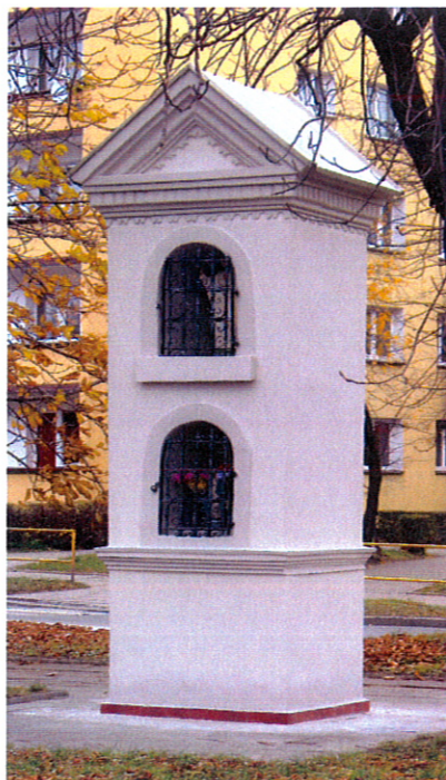
Kapliczka słupowa z ok. 1880 r. przy ul. Elizy Orzeszkowej

kilkanaście metrów z powodu realizacji nowych inwestycji. Część odnowili mieszkańcy (np. kaplicę św. Izydora w Przelajce). Staraniem władz miasta w latach 1998-2011 została odnowiona większość kapliczek i krzyży zlokalizowanych się na gruntach należących do gminy.