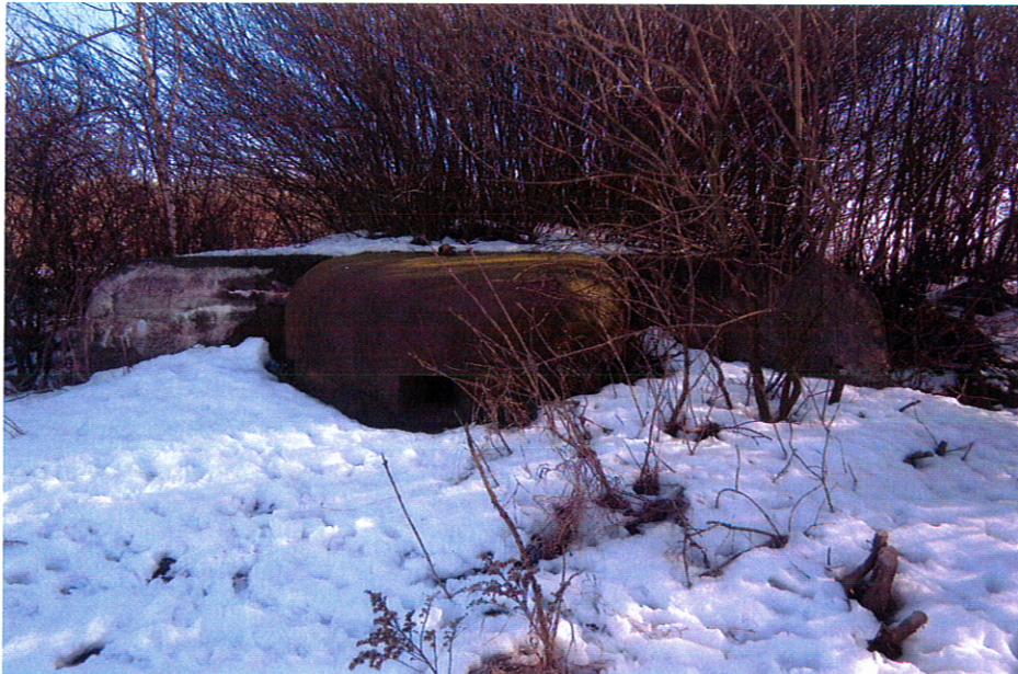
Schron bojowy na terenie Michałkowic

Na terenie pól uprawnych na południe od ulicy Frenzla (wzgórze 304,7) znajdują się dwa polskie schrony Obszaru Warownego "Śląsk" z lat 30. XX w. Na wschód od nich znajdują się dwa schrony wartownicze na terenie byłej kopalni "Michał" i jeden schron wartowniczy na terenie szybu północnego przy ul. Bytomskiej. Jeszcze jeden schron wartowniczy znajduje się przy ul. Krupanka. Stan zachowania: schron z Obszaru Warownego "Śląsk" jest systematycznie podtapiany. Schrony przy ul. Bytomskiej i Krupanka są zabezpieczone (w obrębie posesji) i we w miarę dobrym stanie, podobnie schrony na terenie byłej kopalni "Michał".