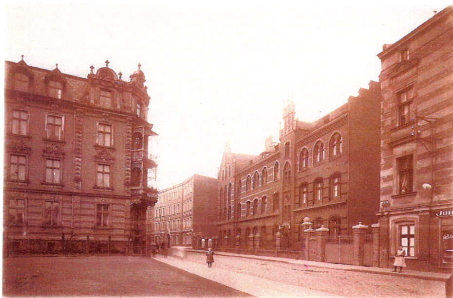
Ulica św. Barbary w I ćw. XX w.