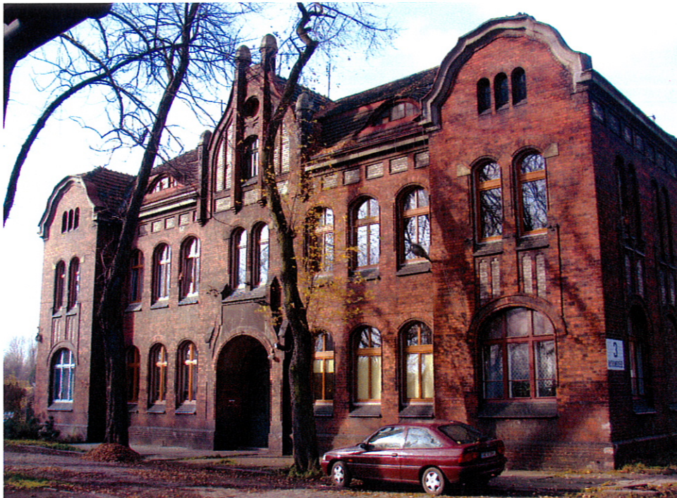
Dawny budynek administracji kopalni "Laurahuta" (rejon Ficusus)

7. Browar: objęty w zapisach aktualnie obowiązującego planu zagospodarowania przestrzennego ścisłą ochroną konserwatorską. Zakupiony przez prywatnego właściciela. Bez zgody Wojewódzkiego Konserwatora Zabytków zlikwidowana została linia produkcyjna browaru. Budynek restauracji został wyremontowany i przywrócono jego funkcję mieszkalną. Obecny właściciel zamierza pozostałe budynki browaru (produkcyjne) zaadaptować na lofty.